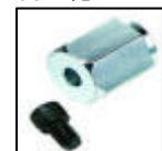
Acople Roloc™ para galletera de 4 1/2"